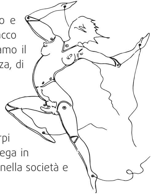
DALLA LOCANDINA DELLA MANIFESTAZIONE A PISA DEL 24 E 25 NOVEMBRE 1979

Siamo state, siamo e saremo Favolose Ribelli .